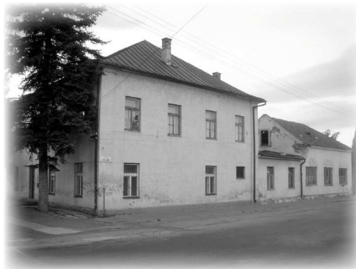
Škola v Drahovciach