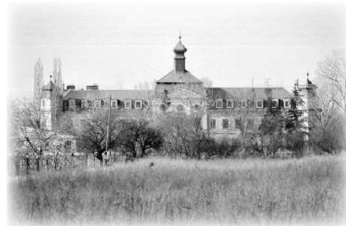
Veľký Biel, Kaštieľ

Od septembra 1951 pôsobili sme vo Velkom Bieli, ktorý je vzdialený od Bratislavy 23 km. V tejto obci je obyvateľstvo až 80 % maďarskej národnosti. Boli tam dve školy. Štvortrieda maďarská a dvojtrieda slovenská. Predstavoval som si, že v zostávajúcich ôsmich rokoch do dôchodku ako tak oddýchnem si po veľkej štrapácii v Drahovciach. Táto nádej ma tiež sklamala, lebo kým som si predstavoval, že tam v blízkosti kultúrneho strediska bude mimoškolská osvetová práca na úrovni, zatiaľ ma veľké nedostatky a zaostalosti presvedčili o pravdivosti porekadla, že pod lampou býva najväčšia tma. Nebol badať ani vplyv dvoch škôl, ani blízkosť Bratislavy. V obci nebol žiaden