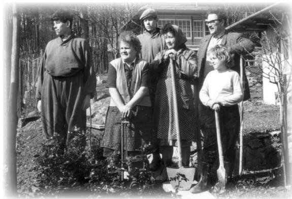
Brigáda v Harmónii

našich dietok brigádnicke sme urobili prístavbu a oplotili sme 7-árový pozemok. Koncom októbra 1960 pristáhovali sa do prístavby manželkiny rodičia. My sme sa mohli presťahovať len o dva roky neskôr, pretože pôvodnú čiastku