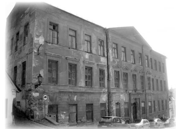
Učiteľský Ústav, Banská Štiavnica