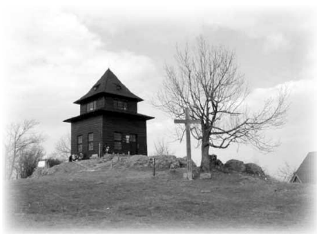
Rozhľadňa na Sitne