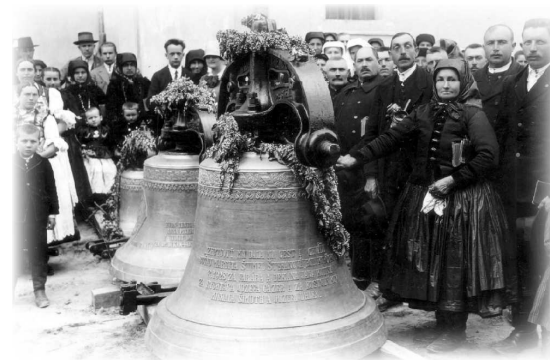
Posviacka Zvonov v Sebechleboch

A ešte záverom k môjmu účinkovaniu v Sebechleboch. Po štyroch rokoch dostal som od vtedajšieho sebechlebského farára dopis v ktorom mi oznámil, že ma v obci občania ešte vždy spomínajú ako legendárnu osobu a