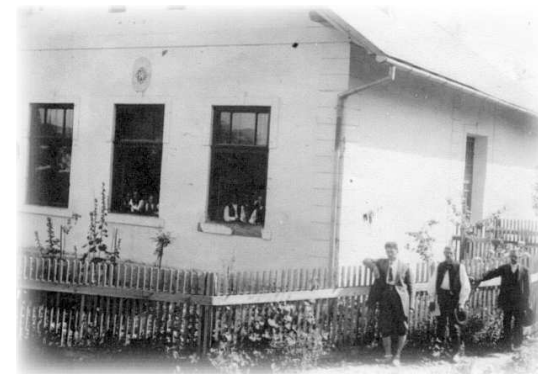
Nová škola v Sebechleboch z Roku 1924