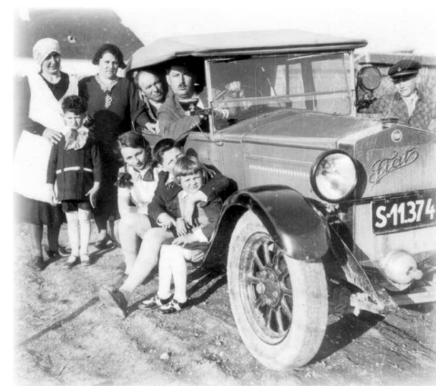
Výlet Matulovcov, Drahovce

V roku 1938 po vyhlásení Slovenského štátu novonastupivší obecní činitelia oslobodili ma od všetkých funkcií v obci. Z politickej nenávisťi podceňovali všetku moju prácu, ktorú som konal svedomito, nestranné a pre dobro všetkého občianstva. Natolko boli zaslepení, že chceli zrušiť mňou objektívne a vecne napísanú obecnú kroniku. Pretože som nebol ľudákom, udávali na biskupský úrad v Trnave falošné obvinenia na mňa, že pracujem proti štátu, HSLS, HG, HM. Dokonca žiadali i moje preloženie.