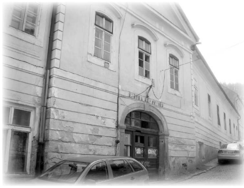
Štátna Nemocnica, Banská Štiavnica

Tušil som, že zvoní mojej mamke lebo v predchádzajúci deň bol som ju v nemocnici navštíviť, už ma nepoznala, lebo ležala v agónii. Pustil som sa do plaču. Učiteľ i spolužiaci ma poľutovali. Pochovaná je v Banskej Štiavnici.